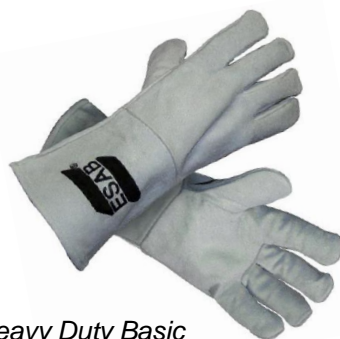
Heavy Duty Basic

Rukavice MIG / MMA musí poskytovat maximální ochranu v nejnáročnějších podmínkách. Tyto rukavice do extrémních podmínek jsou odolné a zároveň měkké a pružné. Ať už jste svářeč na částečný úvazek nebo profesionál, řada rukavic pro těžký provoz MIG / MMA od společnosti ESAB ochrání vaše ruce za všech podmínek.