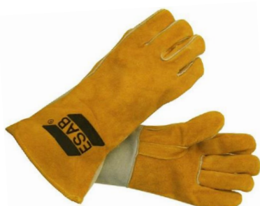
Heavy Duty Regular