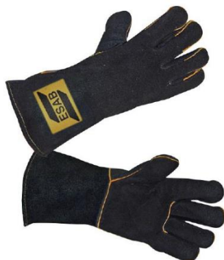
Heavy Duty Black