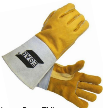
Heavy Duty EXL